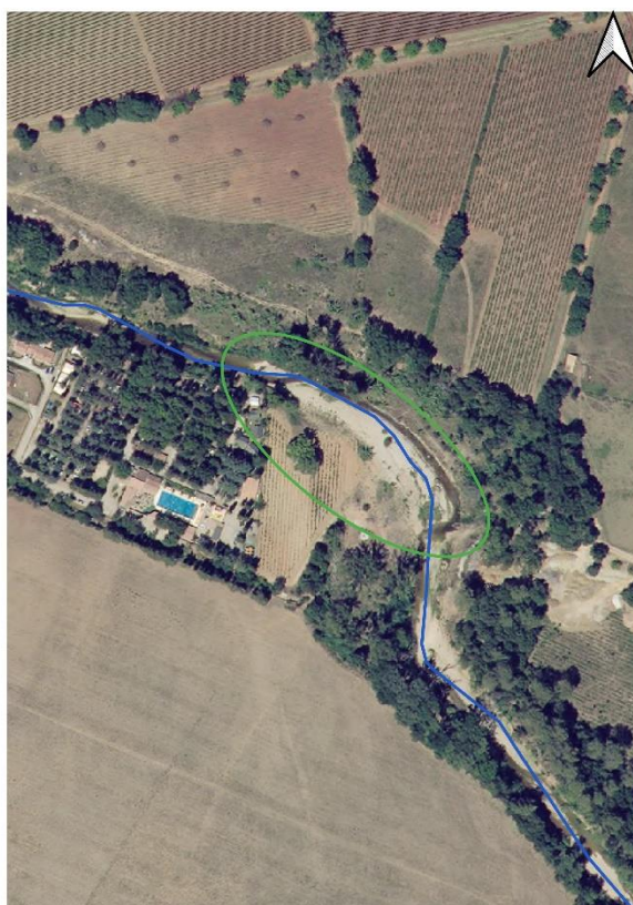
Zone de restauration de la ripisylve