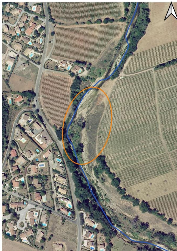
Zone de rechargement sédimentaire